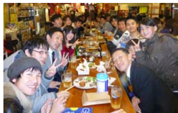
▲前回の様子 / 学生と社会人がテーブルを囲み、様々な話をし、終始盛り上がっていた。

高知市南宝永町4-12 ☎088-804-3070 知寄町一丁目電停から徒歩約3分